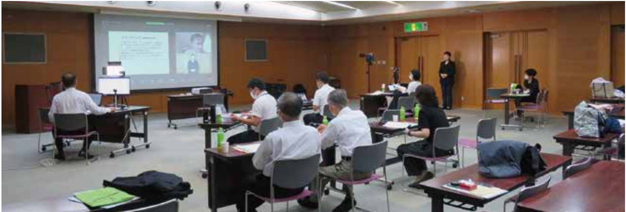
令和4年度 中央研修会・地区研修会 研修会動画撮影の様子